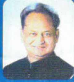
अशोक गहलोत मुख्यमंत्री