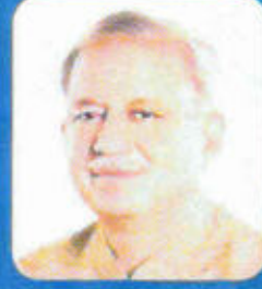
सुभाष गर्ग संस्कृत शिक्षा मंत्री